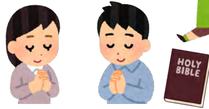
湖畔でデイポーション